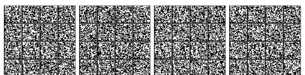
Tabella V.5- 3: Livello di prestazione per controllo dell'incendio